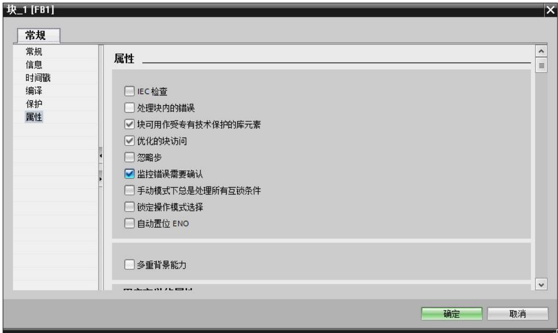
图 2 FB 属性默认为优化的块访问

操作方法： 点击菜单栏的“编辑”，勾选“保持性内部存储器”，GRAPH FB 保持性属性被修改为“保持”，如图 3 所示。